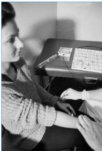
Abb. 17: Resonanztestung an Di 5 li. für den Kiefer mittels Minitubus des RFR

Sie erfolgt demnach mit einem metallfreien Resonator (RFR), der nach o. g. Erkenntnissen, eigenen Erfahrungen sowie den Erkenntnissen der Quanten- bzw. Skalarwellenphysik gestaltet ist. Seine Teile (Wabe, Elektrode, Tu-